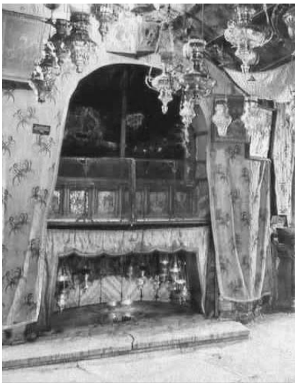
Locul Nașterii Mântuitorului Iisus Hristos

”Domne Iisuse Hristoase, Fiul lui Dumnezeu, miluiește-mă pe mine păcătosul!”