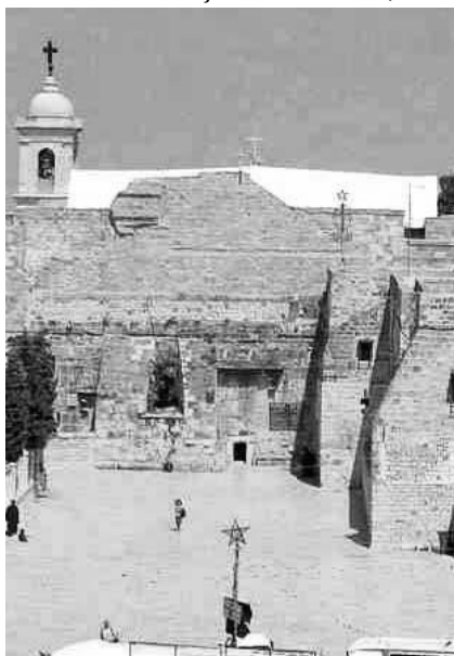
Peștera în care S-a Născut Domnul nostru Iisus Hristos

Doar păstorii, anunțați de îngeri, vin și se închină la păstorul sufletelor și trupurilor noastre. Și magii, călăuziți de steaua strălucitoare, se închină Împăratului nou-născut, dar nu oricum, ci aducând daruri: aur, smirnă și tămâie. Dar ei erau pregătiți: primii, păstorii erau cu sufletele curate și de-o taină cu Păstorul cel bun; ceilalți, magii, erau în cunoștință de cauză,